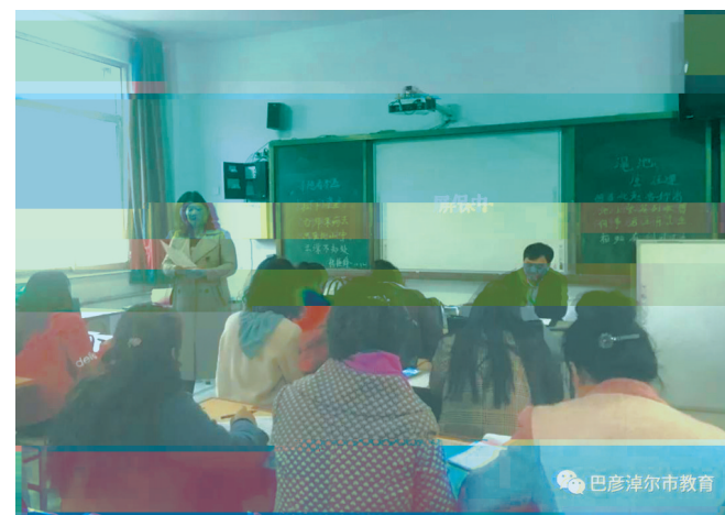
今年10月,巴彦淖尔市某小学开展教师业务培训会,会上介绍了小猿口算等新技术App的功能和优缺点。

不久前,一位家长因未批改孩子口算作业被教师在家长群点名批评,这一遭遇被截图发在网上之后立刻引发了社会的关注。不少家长表示,如今,家长批改作业现象非常普遍,尤其是口算作业枯燥无味,家长的下班时间几乎被家庭作业填满,矛盾一触即发。