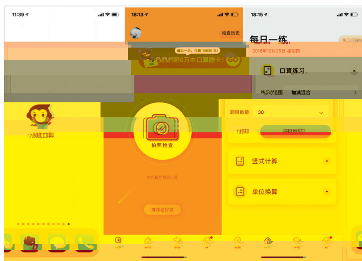
在线练习或选择打印题目练习

俗话说:曲不离口,拳不离手。小学数学尤其是口算能力的培养不是一朝一夕的事,它是一项长期而又艰巨的任务,它是一个循序渐进、逐步提升的过程。口算训练一定要做到持之以恒,常抓不懈。如每天课前5分钟可进行口算专题练习;课后组织学生相互出题练习;有条件的学生在家可让父母出题练习或让孩子跟父母外出购物,帮助家长口算钱数等。