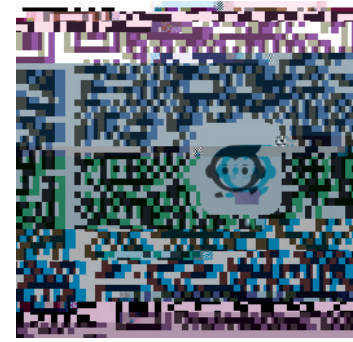
扫描二维码 立刻开始使用吧!

值得一提的是,目前小猿口算APP的所有功能都是完全免费的,而且没有烦琐的注册流程,使用快捷。唯一美中不足的是,它的受益者只是小学数学老师,真希望随着互联网技术的进一步发展,这样的免费优质工具越来越多,功能越来越强大,让各科作业都可以依靠技术手段检查批改。想象一下,这将会给教师们减轻多少工作负担? (孙鹏 季阳)